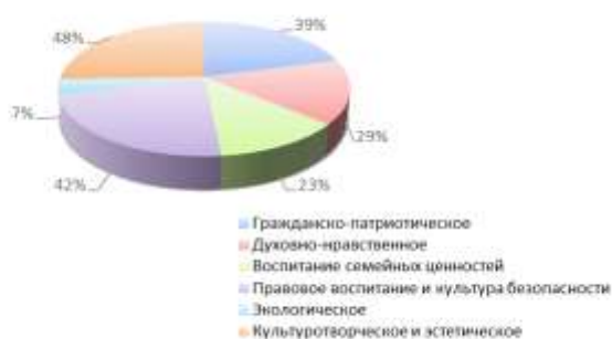
Доля охвата по направлениям воспитательной работы

В целях совершенствования технологических процессов функционирования целевой модели развития системы дополнительного образования в Ямало-Ненецком автономном округе, МАУ ДО МУК «Эврика» одним из первых в муниципальном образовании города Новый Уренгой апробирует технологические решения по внедрению механизмов учёта посещений детьми общеразвивающих программ посредством государственной информационной системы «Единая карта жителя Ямала».